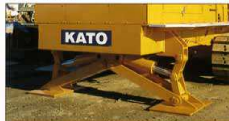
● 揺動反力に強いリヤ・アウトリガ