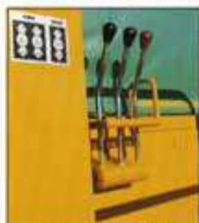
● 視界の広い走行レバー