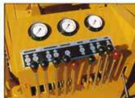
● 操作のやりやすい揺動コントロールレバー