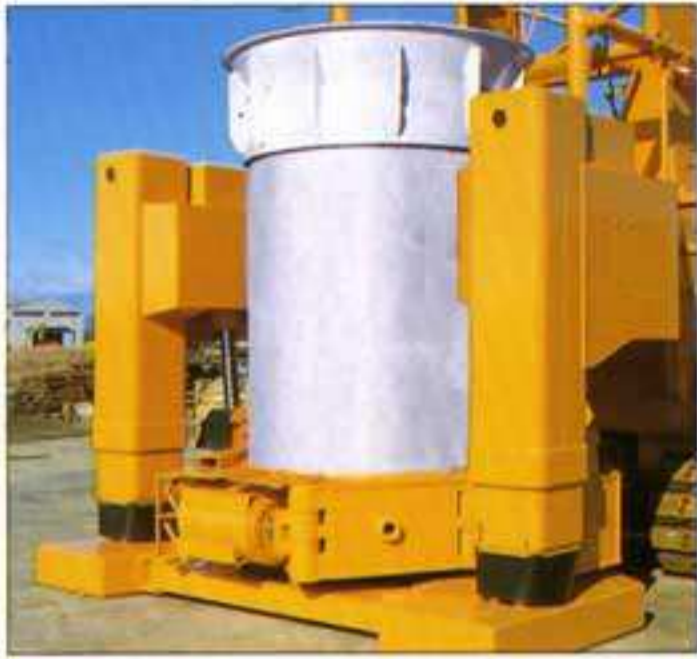
● 芯出し、強力な掘削揺動装置