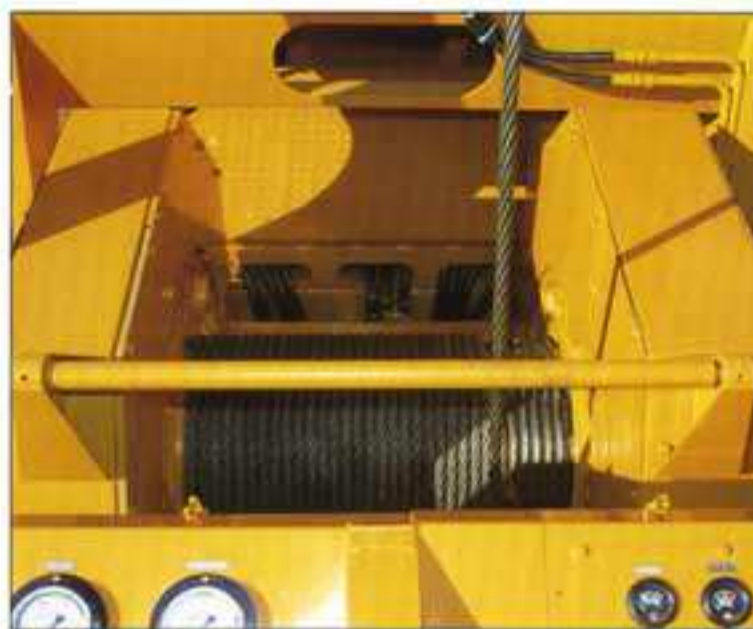
● スピーディなウインチ