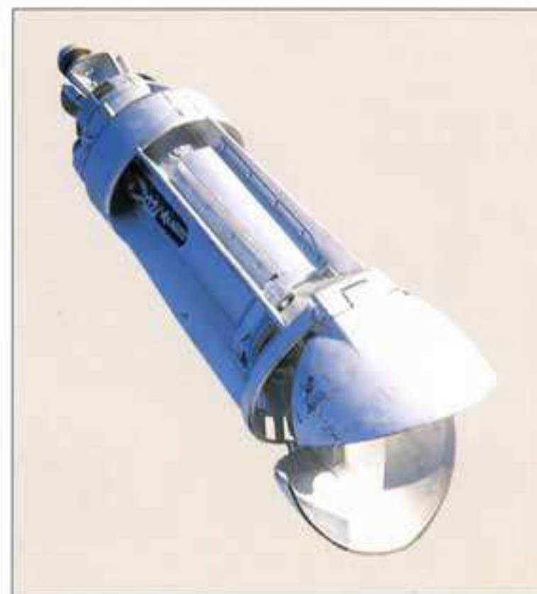
● 堅牢なグラブバケット