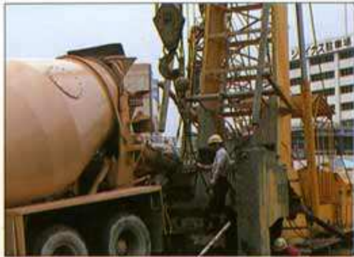
● 生コンクリートの打設