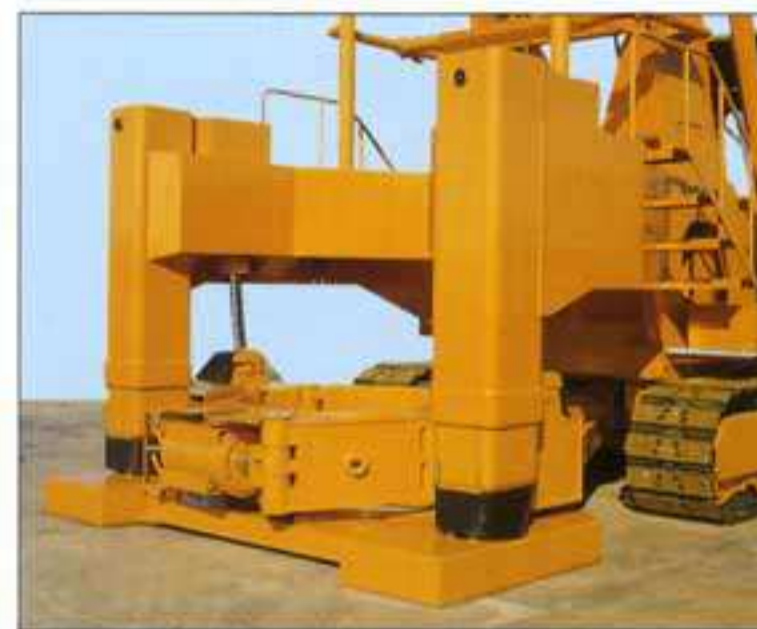
● 堅牢なフロント・アウトリガ